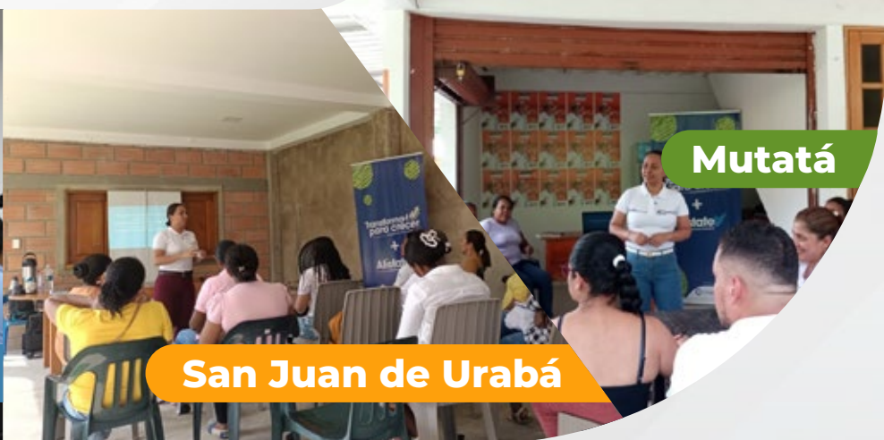
San Juan de Urabá